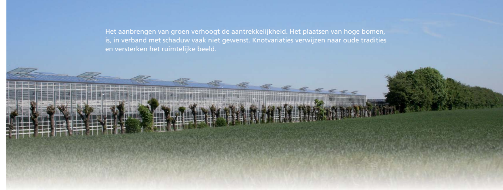
Het aanbrengen van groen verhoogt de aantrekkelijkheid. Het plaatsen van hoge bomen, is, in verband met schaduw vaak niet gewenst. Knotvariaties verwijzen naar oude tradities en versterken het ruimtelijke beeld.

Een nieuwe uitstraling hoeft niet duur te zijn. Zelfs met een klein budget kunt u grote resultaten behalen. Voor ieder ambitieniveau geldt dat u ruimtelijke kwaliteit kunt toevoegen en de uitstraling van uw bedrijf kunt verbeteren. De positionering van beeldbepalende elementen en de keus voor materiaal, kleur, ritme, contrast en groenaankleding spelen hierbij een belangrijke rol.