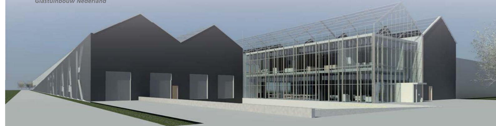
De 300 meter lange gevel van Ter Laak Orchids langs de N211. De karakteristieke kassenuitstraling is doorgezet in een transparant kantoor met zicht op de omgeving. Andersom, vanaf de weg kun je het personeel zien zitten.