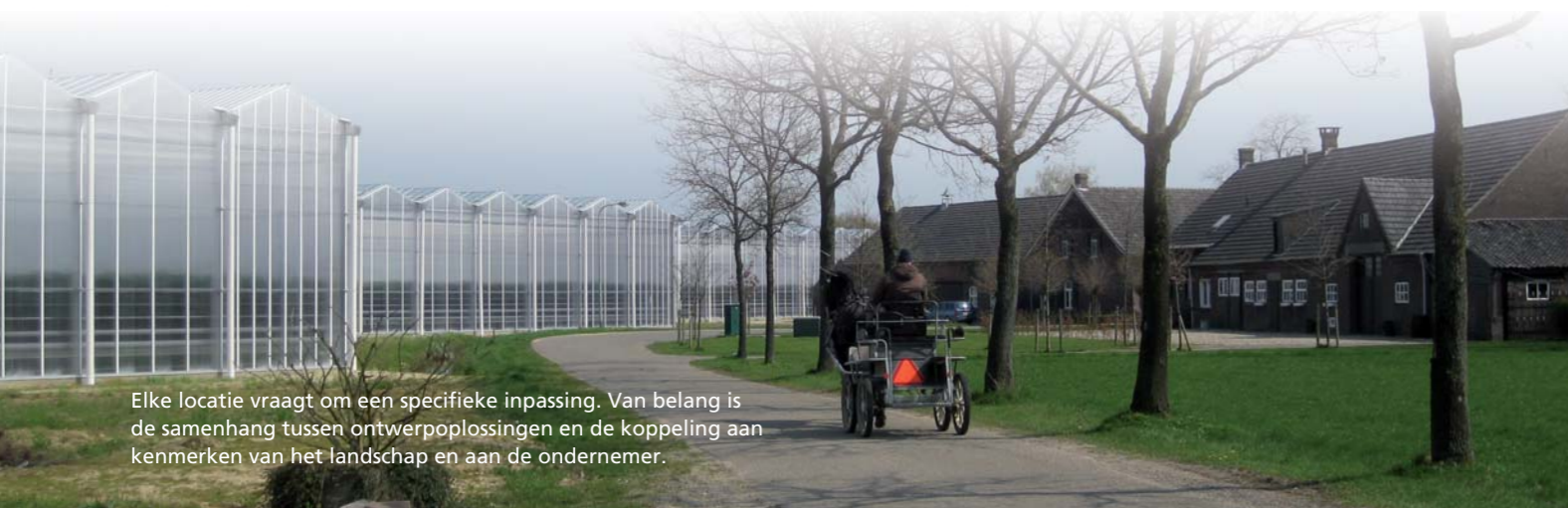
Elke locatie vraagt om een specifieke inpassing. Van belang is de samenhang tussen ontwerp oplossingen en de koppeling aan kenmerken van het landschap en aan de ondernemer.

Basis met groen, architectuur, inpassing in het landschap en (interactieve) kunst Een kunstobject dat interactief reageert op de omgeving en passanten geeft een extra dimensie aan de omgeving en verhoogt daarmee de kwaliteit van die ruimte. In dit voorbeeld is er gekozen voor wuivende orchideeën. Zodra er iemand langs het kunstobject loopt, fietst of rijdt verkleuren de bloemblaadjes door middel van led verlichting.